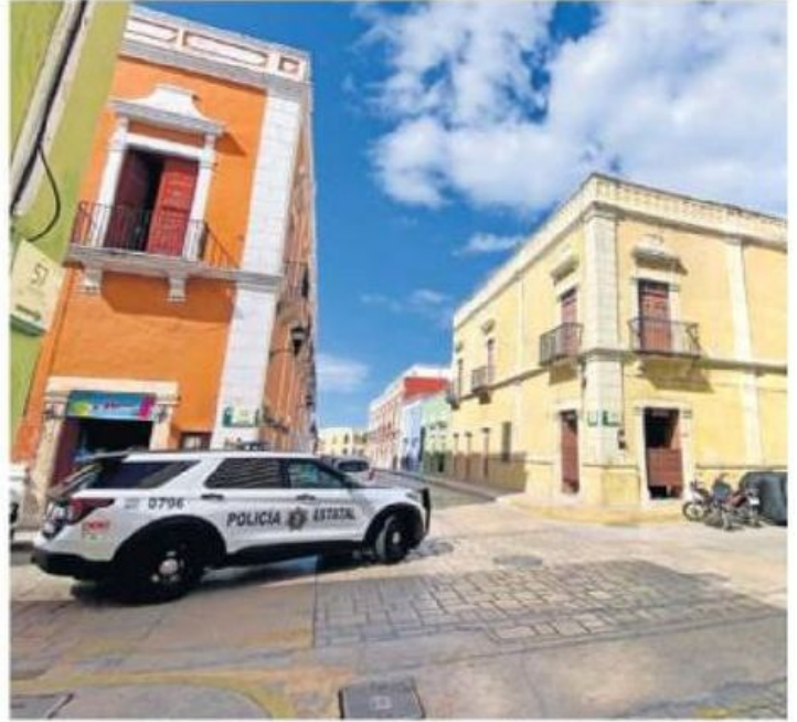
La Corte determinó que cualquier proyecto en Campeche deberá contar con el aval de los municipios, por lo que frenó los planes de Sansores.