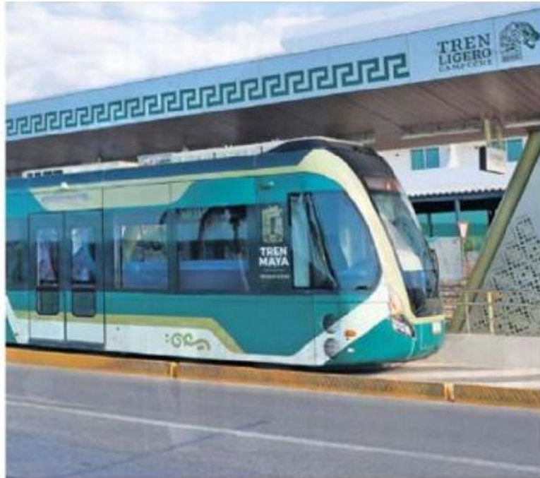
La población considera que el tren ligero fue un gasto innecesario y muy caro; la gente no lo usa.