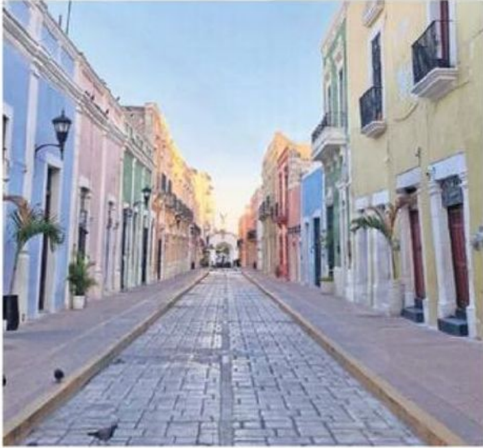
Campeche parece tranquilo para sus habitantes, pero la sombra de la censura se cierne sobre aquellos que disienten del gobierno.