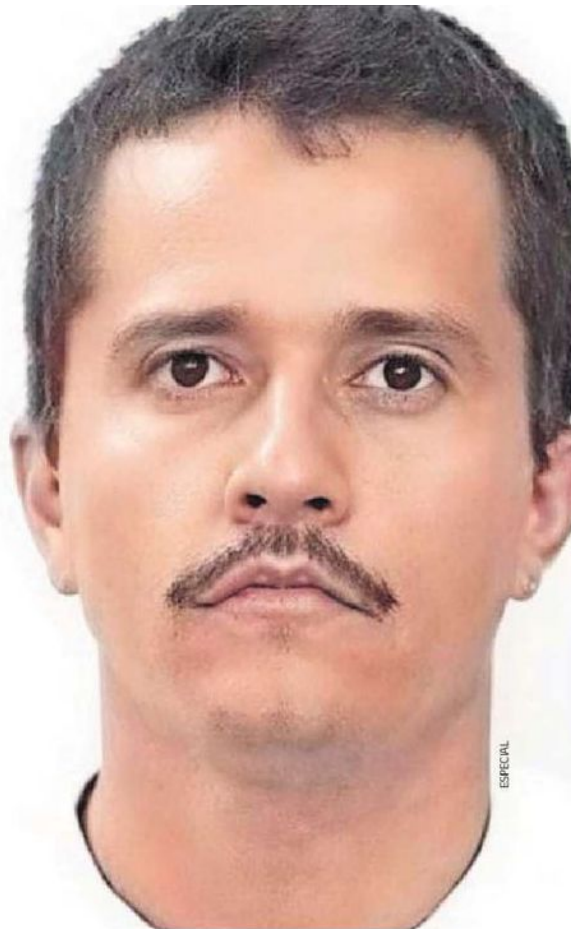
Nemesio Rubén Oseguera Cervantes, alias El Mencho , líder del Cártel Jalisco Nueva Generación (CJNG) , fue abatido por fuerzas federales el día de ayer.

1 Tras una década prófugo y con colaboración de inteligencia de EU, el Ejército abatió a Nemesio Oseguera Cervantes en Jalisco, donde resultó herido y falleció en su traslado a la CDMX. A4