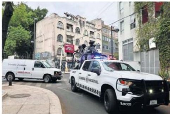
Camionetas artilladas de la Guardia Nacional escoltaron una ambulancia del Semefo, donde presuntamente llevaban el cuerpo de El Mencho .