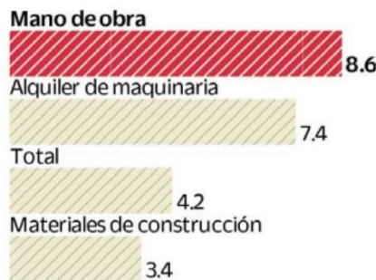
Por insumos Variación % anual, noviembre 2024