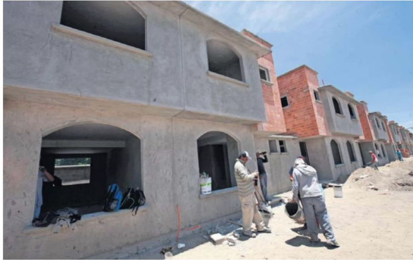
La construcción de vivienda de todo tipo se frenó durante 2020 y 2021 debido a la pandemia de Covid-19, y el inventario que quedaba está a punto de agotarse, alertan.