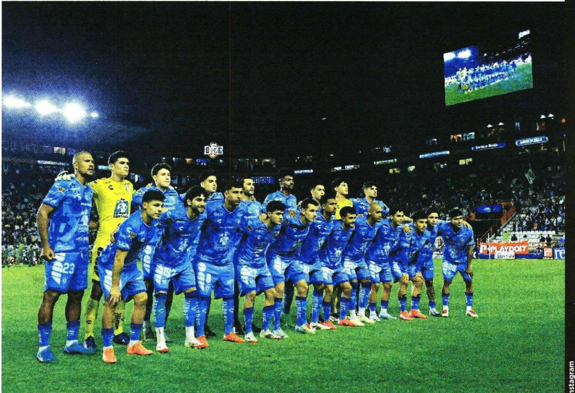
Los partidos de los Tuzos volverán a ser transmitidos en streaming por la plataforma Tubi.