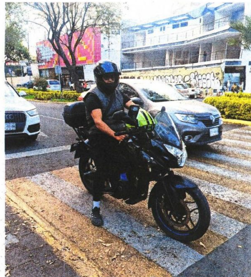
En la Zona Metropolitana del Valle de México es común el servicio de taxi en motocicleta por aplicación, pese a que está prohibido en la Ciudad de México y falta su regulación en el Estado de México.