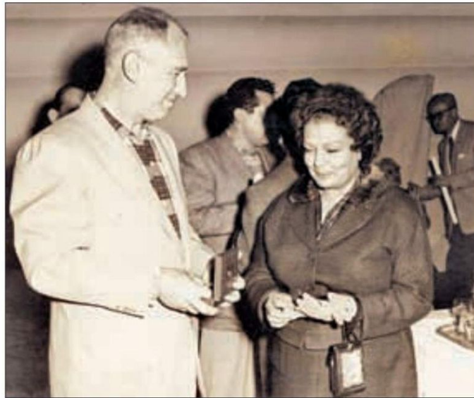
► Anuncio de programa radial de Cri-Cri de 1935; abajo, el músico y su esposa Rosario. Imágenes, cortesía de la Fundación Francisco Gabilondo