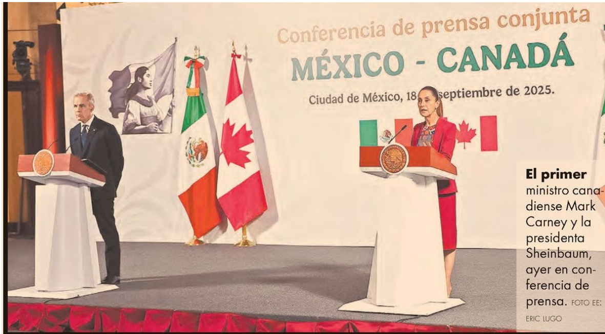
El primer ministro canadiense Mark Carney y la presidenta Sheinbaum, ayer en conferencia de prensa.