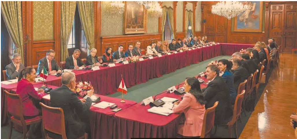
El primer ministro Carney, ayer, en reunión con integrantes del gabinete de la presidenta Sheinbaum y de la comunidad empresarial.