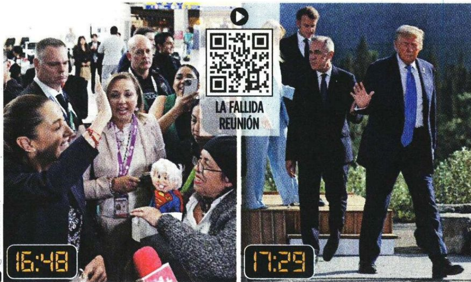
■ Después de la llegada de Sheinbaum en vuelo comercial a Canadá, Trump canceló su participación en la cumbre del G7.