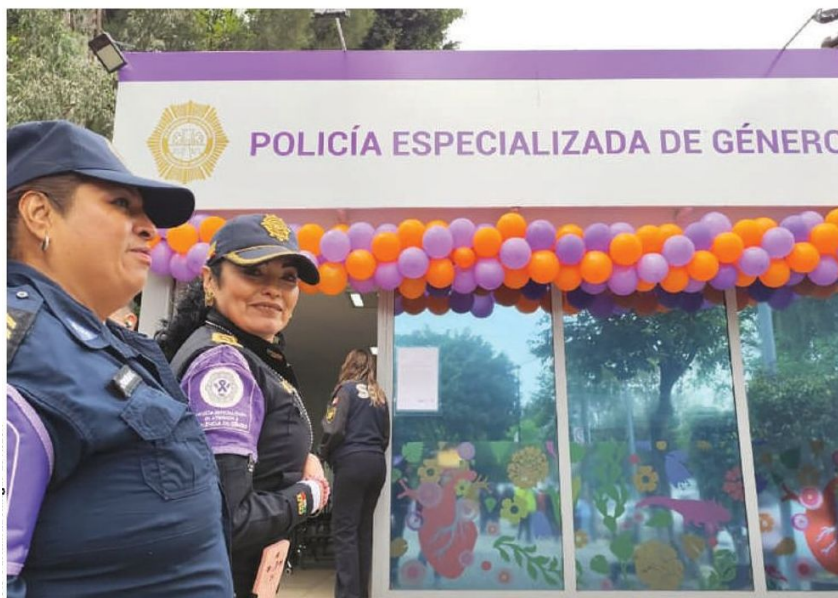
DOS OFICIALES afuera de la estación violeta de la SSC en Tlatelolco, ayer.