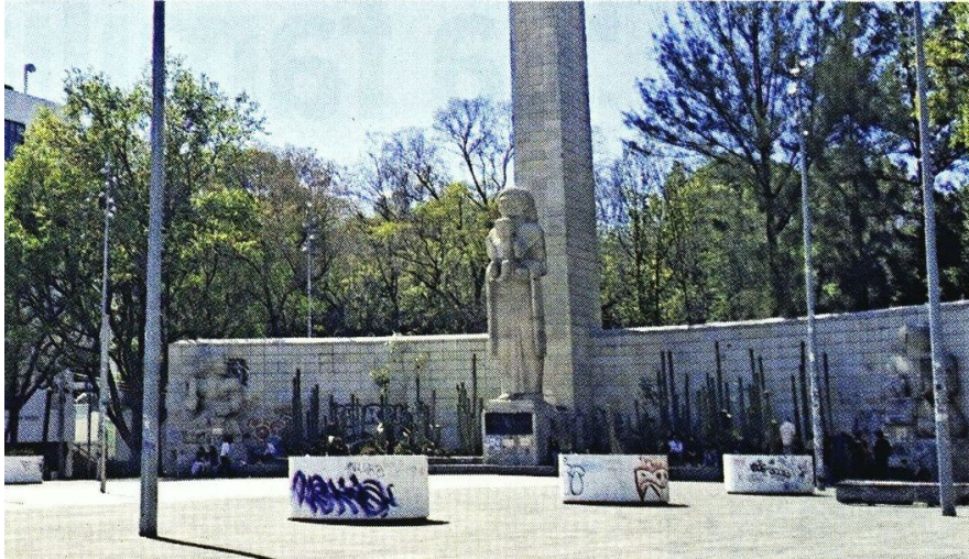
El Monumento a la Madre Luce actualmente vandalizado, pese a la renovación ocurrida en 2017.