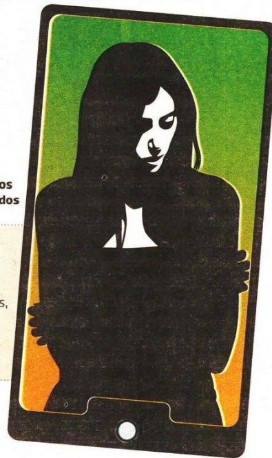
Gráfico: Rodolfo Gómez García

Fuente: Código 181 Quintus del Código Penal de la CDMX