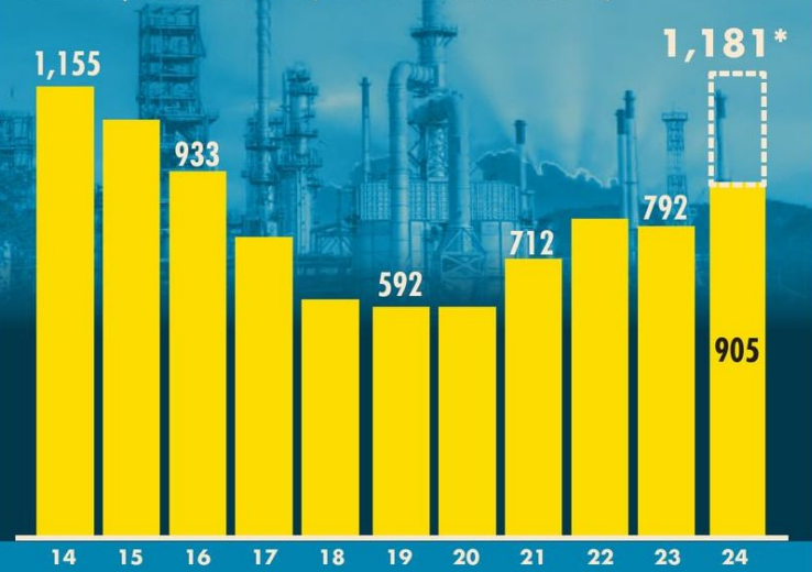
Pemex | Proceso de crudo y elaboración de combustibles, ene-dic | PROCESO TOTAL (MILES DE BARRILES DIARIOS)