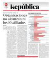
Gráfico: Daniel Rey