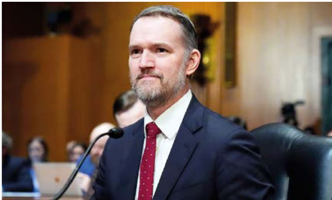
ESQUEMA COMPLEJO. Jamieson Greer, representante comercial de EU, afirma que los gravámenes han sido todo un éxito.