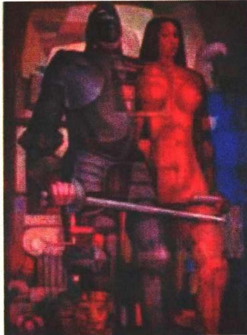
También de González Camarena, La Pareja (1964), donde aparecen Cortés y Malinche, igual representada por la musa del artista.