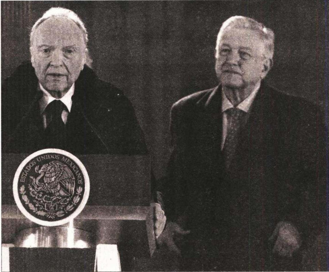
El fiscal Alejandro Gertz Manero y el presidente Andrés Manuel López Obrador.