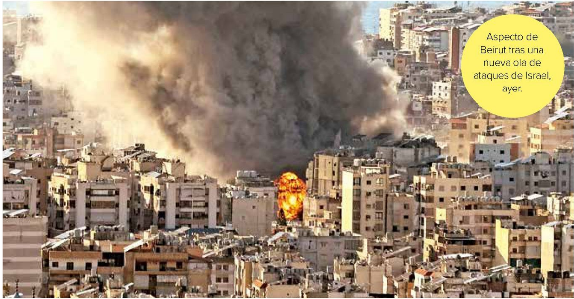
Aspecto de Beirut tras una nueva ola de ataques de Israel, ayer.