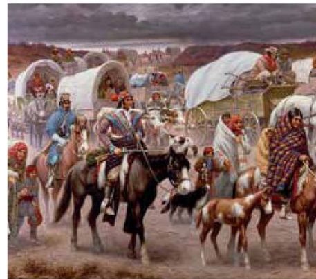
Sendero de las Lágrimas, la ruta del destierro de los indios norteamericanos. (Foto: Wikimedia Commons/ Robert Lindneux)

Pero México no fue la única sociedad afectada por el expansionismo estadounidense. De acuerdo con un cuadro de Élise Marienstras (La resistencia india en Estados Unidos, Siglo XXI), de 1540 a 1978, la élite estadounidense no solo se apropió de los territorios de las comunidades indígenas originarias, sino que desarrolló una estrategia de despojo de las tierras de los indios