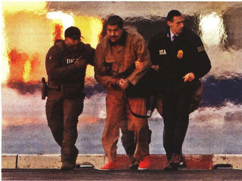
Comparecencia ante el juez Alvin Hellerstein y su traslado previo.