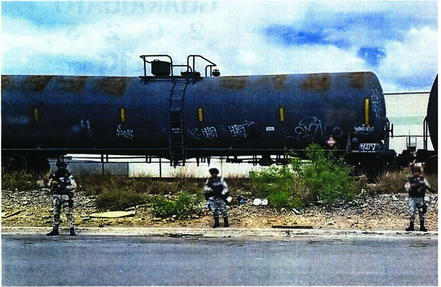
Los 129 carrotaques asegurados en Coahuila tenían sellos con la leyenda Lambrucar, empresa con sede en Houston, Texas, Estados Unidos, y con sucursales en México.