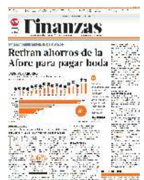
Gráfico: Alejandro Gómez