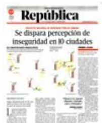
Gráfico: Rodolfo Gómez García