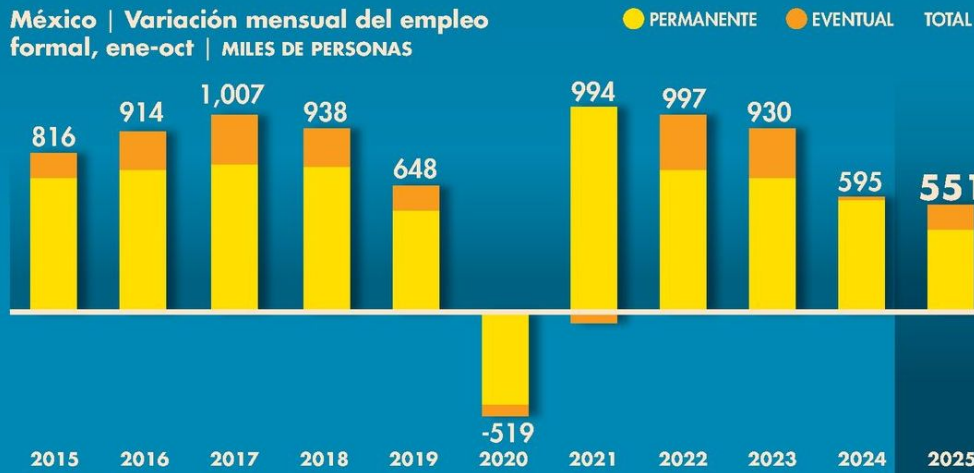
México | Variación mensual del empleo formal, ene-oct | MILES DE PERSONAS

En el décimo mes del año, uno de cada cuatro empleos formales generados está asociado al programa de plataformas digitales de transporte, vigente desde julio.