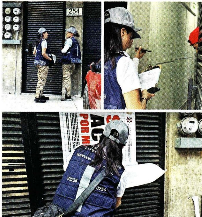
■ El edificio de San Alejandro 254, en Pedregal de Santa Úrsula, fue construido pese a que no han exhibido permisos.