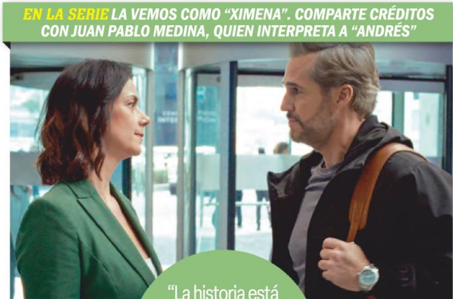
EN LA SERIE LA VEMOS COMO “XIMENA”. COMPARTE CRÉDITOS CON JUAN PABLO MEDINA, QUIEN INTERPRETA A “ANDRÉS”

“La historia está basada en hechos reales. Le sucedió a un doctor italiano (perdió la memoria de un tiempo determinado)”.