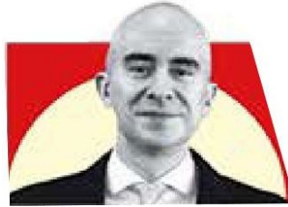
CARLOS TORRES ROSAS

CARLOS TORRES ROSAS. EL NUEVO DIRECTOR GENERAL DE NAFIN Y BANCOMEXT REFRENDA SU COMPROMISO DE TRABAJAR EN EL DESARROLLO DEL PAÍS. PÁG. 7