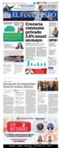
Banca de desarrollo. La presidenta Sheinbaum nombró a Torres Rosas.