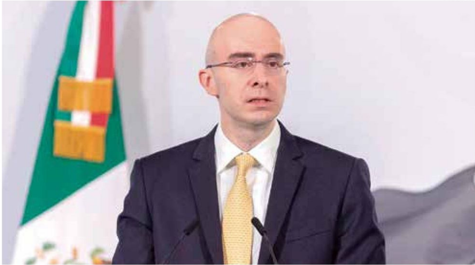
COMPROMISO. El funcionario agradeció la confianza y el respaldo de Claudia Sheinbaum.