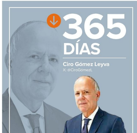
Ciro Gómez Leyva X: @CiroGomezL