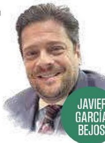
JAVIER GARCÍA BEJOS

CON LA LLEGADA del vuelo de Tijuana a Puerto Escondido de Volaris, son ya seis rutas nacionales a este destino que ha crecido exponencialmente en los últimos años. La oferta de vuelos también incluye cinco rutas internacionales de Estados Unidos y Canadá. En un esfuerzo coordinado entre Aeropuertos Mexicanos de Javier García Bejos , Grupo Aeroportuario Turístico Mexicano (GATM) y el gobierno de Oaxaca, el aeropuerto ha aumentado 34% el número de viajeros, apoyado en una inversión mixta de más de tres mil millones de pesos. La conectividad con Tijuana también apuesta por atraer a usuarios del sur de California que pueden llegar a esta ciudad utilizando el Cross Border Express. El vuelo de Volaris, que capitanea Enrique Beltranena , operará inicialmente tres veces por semana. Las obras de la nueva ter-