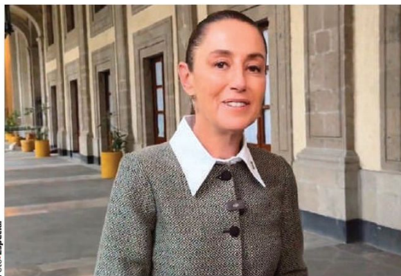
LA JEFA DEL EJECUTIVO envió ayer un mensaje de unidad desde Palacio Nacional.