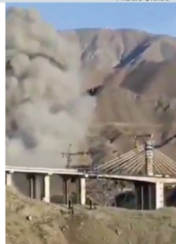
DERRUMBE del puente más alto de Irán.

TODD BLANCHE LLEGA A: Departamento de Justicia FUE: Abogado personal de Trump