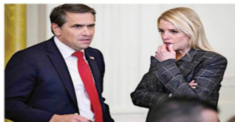
El Presidente Trump designó a Todd Blanche como Fiscal General interino tras ordenar la destitución de Pam Bondi.