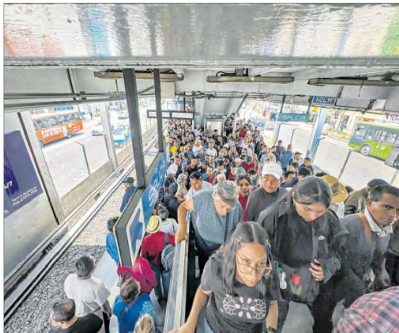
▲ Cientos de pasajeros formaron largas filas en la estación Xola para subir a los camiones que los llevarán hasta Pino Suárez, aunque algunos

optaron por usar taxi. La línea operará hoy con normalidad en horario de día festivo, a excepción de San Antonio Abad.