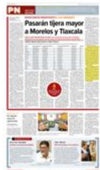
Tabla: Realizada con datos de los presupuestos de egresos estatales 2026, tomados de sus periódicos oficiales.