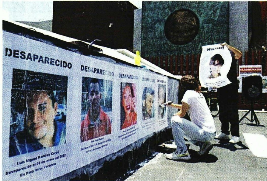
■ El Comité de la ONU ofreció a México cooperación técnica en las áreas de búsqueda, análisis forense e investigación para la búsqueda de personas.