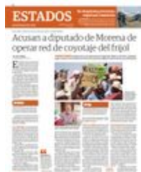
EL DIPUTADO de Morena José Narro Céspedes, el miércoles durante un mensaje.