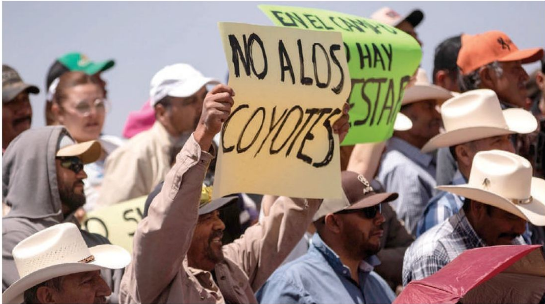
PRODUCTORES protestan contra el coyotaje, el 28 de marzo en Sombre- rete, Zacatecas.